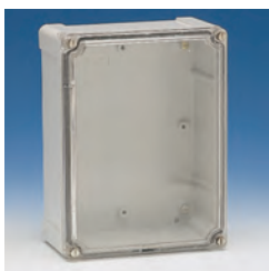
Rectangular tapa transparente