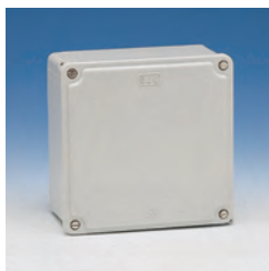
Cuadrada tapa opaca