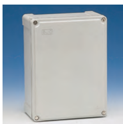
Rectangular tapa opaca