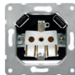
Schuko® 2P+T con doble cargador USB 18524-USB